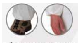
PUÑOS Y TOBILLOS ELÁSTICOS