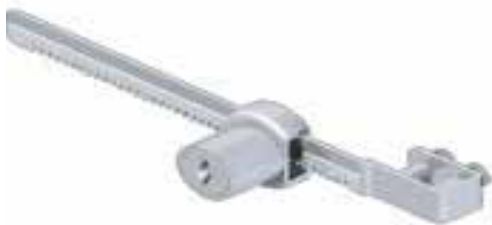
Cerradura Muebles Odis Vitrina 1690-1814 cod: CEM0000104 Cerradura Muebles Odis Vitrina 1690-1814 Cremallera de 140 mm cod: CEM0000103