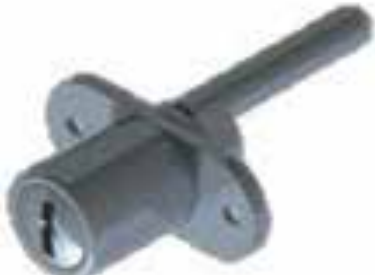
Cerradura Muebles Odis Kardex Frontal 2351-1820 C.Intercambiable cod: CEM0000025