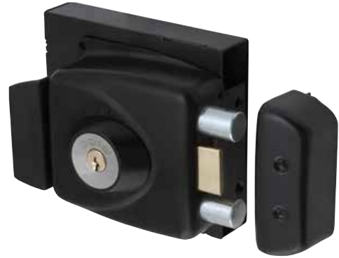
Cerradura Sobreponer Odis 773 con caja metálica cod: CEP0000923