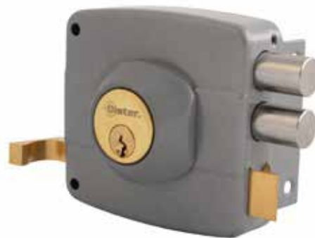
Cerradura Sobreponer Oister 110 cod: CEP0000275