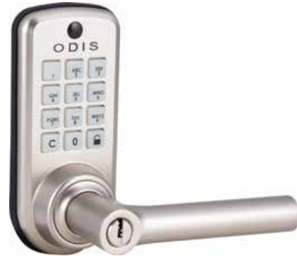
Cerrojo Digital Odis 6400 cj cod: CEP0001181