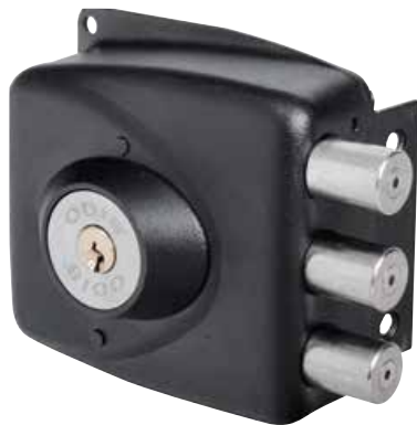
Cerradura Sobreponer Odis 751 cod: CEP0001024