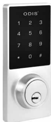
Cerrojo Digital Touch + Tarjeta + Llave 7300 Inox cod: CEP0001320