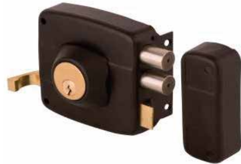
Cerradura Sobreponer Odis 321 cod: CEP0000707