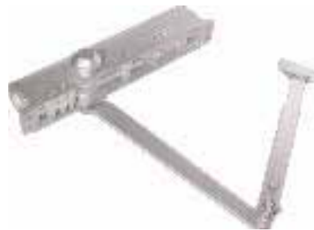
Cierra Puerta Hidráulico Odis 1120 (65120)