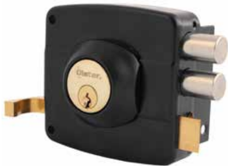
Cerradura Sobreponer Oister 110 cod: CEP0000274