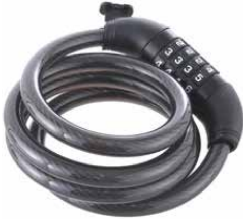
Candado Odis Cablelock 120 120 cms Negro cod: CAN0000108