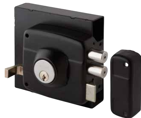
Cerradura Sobreponer Odis 323 cod: CEP0000711