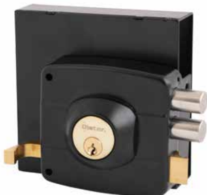
Cerradura Sobreponer Oister 111 con caja cod: CEP0000276