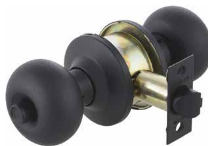
Cerradura Cilíndrica Odis 206 Simple Paso G1 cod: CEP0000880 Cerradura Cilíndrica Odis 206 Baño G1 cod: CEP0000879 Cerradura Cilíndrica Odis 206 Dormitorio G1 cod: CEP0000878 Cerradura Cilíndrica Odis 206 Acceso G1 cod: CEP0000877