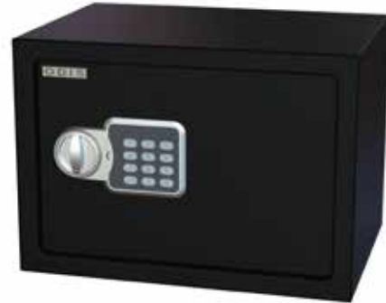
Caja Residencial Odis Hogar 14,9 Lts Negro cod: CAJ0000476