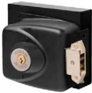
Cerradura Sobreponer Odis 793 con caja metálica cod: CEP0001025