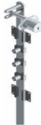
Cerradura Muebles Odis Kardex Frontal 2351-1920 con barra 120 (Ex 288) Diámetro 19 mm / Largo 20 mm - Largo barra 120 cm. Cilindro de 19 mm. - Instalación frontal