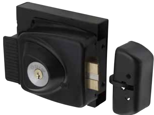
Cerradura Sobreponer Odis 783 Eléctrica con caja metálica apertura interior cod: CEP0000925