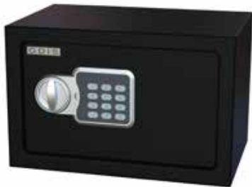
Caja Residencial Odis Personal 8,5 Lts Negro cod: CAJ0000475