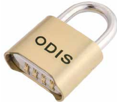
Candado Odis Stylelock 52mm cod: CAN0000133