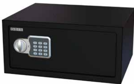
Caja Residencial Odis Laptop 23,9 Lts Negro cod: CAJ0000477