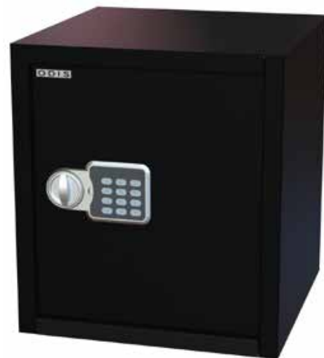
Caja Residencial Odis Oficina 40 Lts Negro cod: CAJ0000478