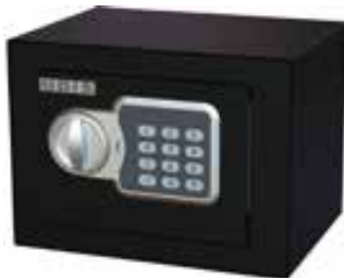
Caja Residencial Odis Mini 4,2 Lts Negro cod: CAJ0000474