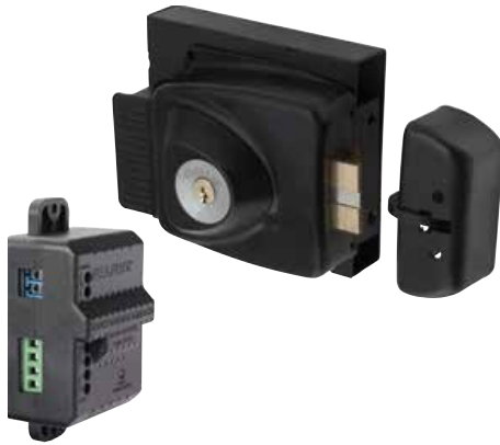
Kit Cerradura Sobreponer Eléctrica Odis 783 + Transformador cod: CEP0001277